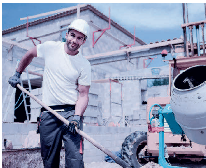
Zu den meldepflichtigen Berufsarten gehören neu alle Tätigkeiten für Hilfsarbeitskräfte, mit Ausnahme von Reinigungspersonal.

Liste der meldepflichtigen Berufsarten 2020: www.arbeit.swiss > Arbeitgeber > Stellenmeldepflicht