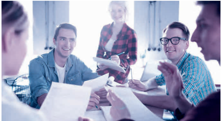
Aktionärbindungsvertrag: ein sinnvolles Instrument, um in guten Zeiten vorausschauende Regelungen für schwierige Phasen zu definieren.

Fast alle Aktionärbindungsverträge sehen Veräusserungsbeschränkungen vor, gerade in Familienbetrieben und Aktiengesellschaften mit wenigen Aktionären. Beispielsweise erwirbt man mit einem Kaufrecht das Recht, Aktien zu erwerben, ohne dass die Zustimmung der anderen Partei erforderlich wäre. Das kann sinnvoll sein, wenn ein Unternehmensaktionär bei der Gründung nicht das ganze Aktienkapital aufbringen kann, aber später den Anlegeraktionär auskaufen will. Vorhandrechte wiederum verpflichten dazu, seine Aktien der anderen Partei anzubieten, bevor ein Vertrag mit einem Dritten abgeschlossen wird. Ein Vorkaufsrecht berechtigt dazu, anstelle eines Dritten zu den Konditionen,